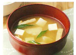
みそ汁に、スープに