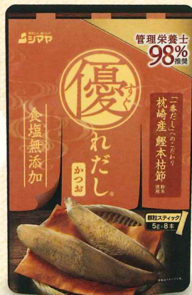
枕崎産 鯉本枯節 粉末使用