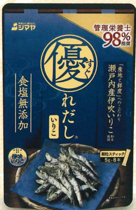
瀬戸内産 伊吹いりこ 粉末使用