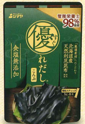
北海道産 天然利尻昆布 粉末使用