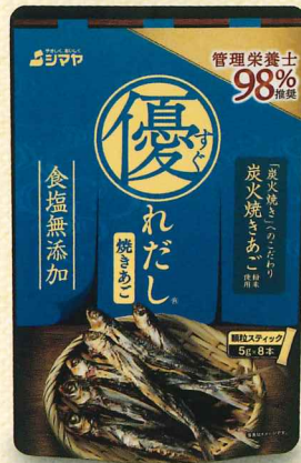
焼き干し製法 炭火焼きあご 粉末使用