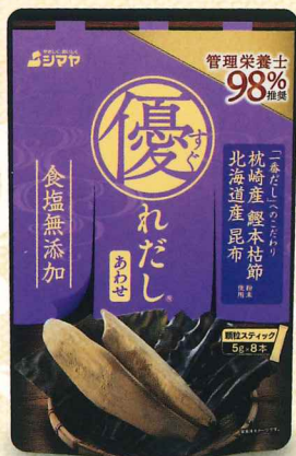
枕崎産 鯉本枯節・ 北海道産 昆布 粉末使用